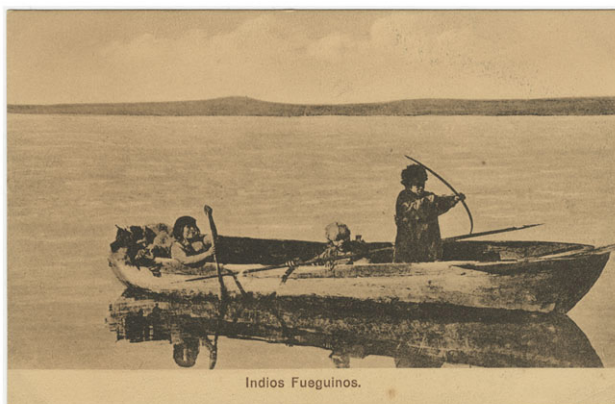
Imagen 2: Mujeres canoeras en actitud de caza marina, sin fecha. Autor desconocido.

Fuente: Archivo Museo Histórico Nacional.