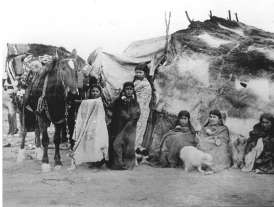
Imagen 1. Mujeres y niñas aonikenk posando en el exterior de sus “kau” (toldos) y de un caballo cargado de enseres.

“El kau, toldos o chozas actual, se arma enterrando en el suelo algunos palos o piquetes de roble, de una a tres varas de alto, y dispuesto en tres hileras: al frente los más largos; luego los medianos y en la parte posterior los otros. Sobre esta armazón tienden una especie de manta o cubierta hecha con pellejo de guanaco adulto, cuya lana de intento, dejan al exterior. Estiran enseguida la cubierta, amarran su reborde frontal a los palos delanteros provistos de pequeñas horquetas y fijan en tierra con estacas los bordes laterales. Tal es el hogar tehuelche, obra exclusiva de la mujer” (Lista, 1998, p. 67).