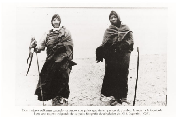
Imagen 3: Dos mujeres selknam cazando tucutucus con palos que tienen puntas de alambre, 1914. Fotografía de Alberto María de Agostini.

Fuente: Archivo Museo Histórico Nacional.