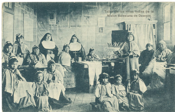
Imagen 8: Taller de niñas indígenas junto a las misioneras en la Misión Salesiana de Isla Dawson en 1898.