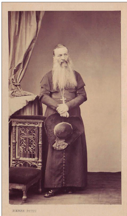
Figura 4. Monseñor Giuseppe Valerga, 1869.

propia, se conoce que sus maneras de presentarse en público son afectadas [y] parece que se ocupa mucho de su larga barba y sus vestidos” (Echaurren, 1854b, p. 209).