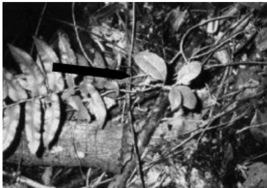
FIGURA 2. REGENERACIÓN NATURAL DE PITAO EN PREDIOS DE FORESTAL MININCO.

De acuerdo a Saavedra & Pincheira (1991), en cinco predios de Forestal Mininco,