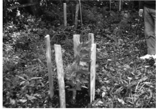
FIGURA 3. PLÁNTULAS DE PITAO ( Pitavia punctata ) EN SECTOR LOS GUINDOS DE LA RESERVA NACIONAL MALLECO.

La Reserva Nacional Malleco al perecer reunió condiciones de hábitat similares a las de su ambiente natural, lo que permitió que al ser trasladada la especie, desde la cordillera de Nahuelbuta a otro hábitat en la precordillera andina, se adaptara adecuadamente a las nuevas condiciones ambientales (Fig. 3).