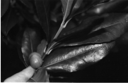
FIGURA 4. PRIMEROS FRUTOS DE PITAO EN EL RODAL SEMILLERO (RESERVA NACIONAL MALLECO, MARZO DE 2000).

First pitao fruits in the seedling rodal (Malleco Natural Reserve, march 2000).